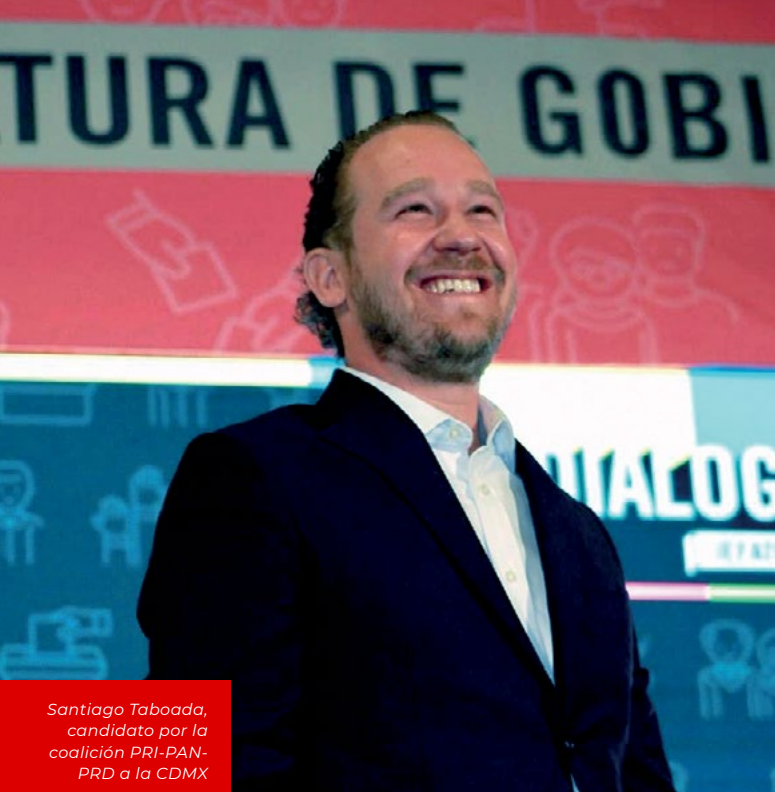
Santiago Taboada, candidato por la coalición PRI-PAN- PRD a la CDMX

potabilizadoras o de tratamiento, además, implementar proyectos de captación de agua de lluvia a nivel doméstico y comunitario. Limpieza de ríos y lagos, programa de reforestación, fondo exclusivo para la gestión del agua y Nueva Cultura de cuidados del Agua. Impulsar una campaña para una cultura de cuidado del agua.