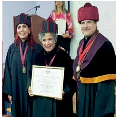
Paredes Rangel dio un emotivo mensaje a sus compañeras por el reconocimiento y lo merecido que fue por sus carreras y aportación a la sociedad.