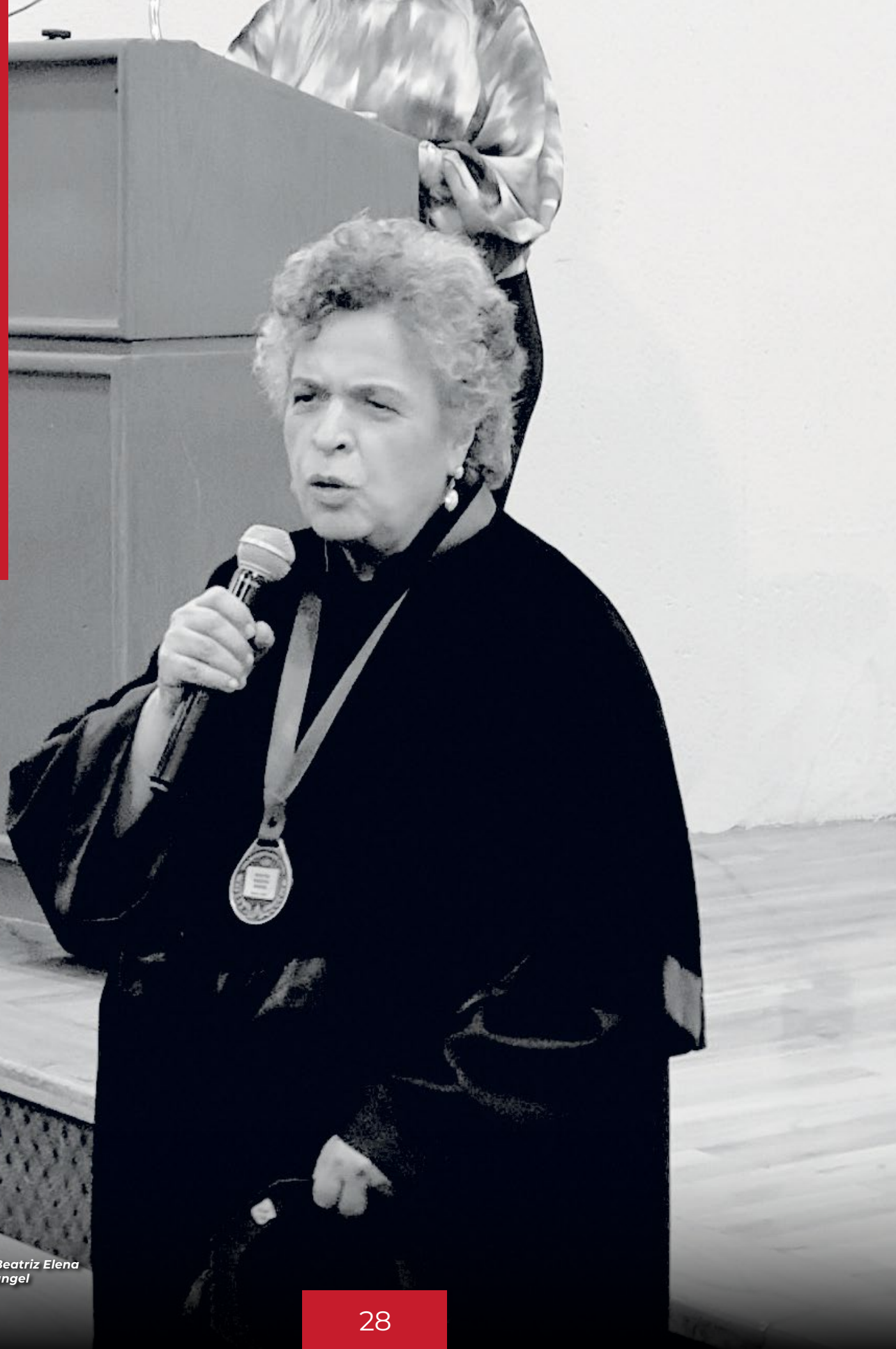
Senadora Beatriz Elena Paredes Rangel