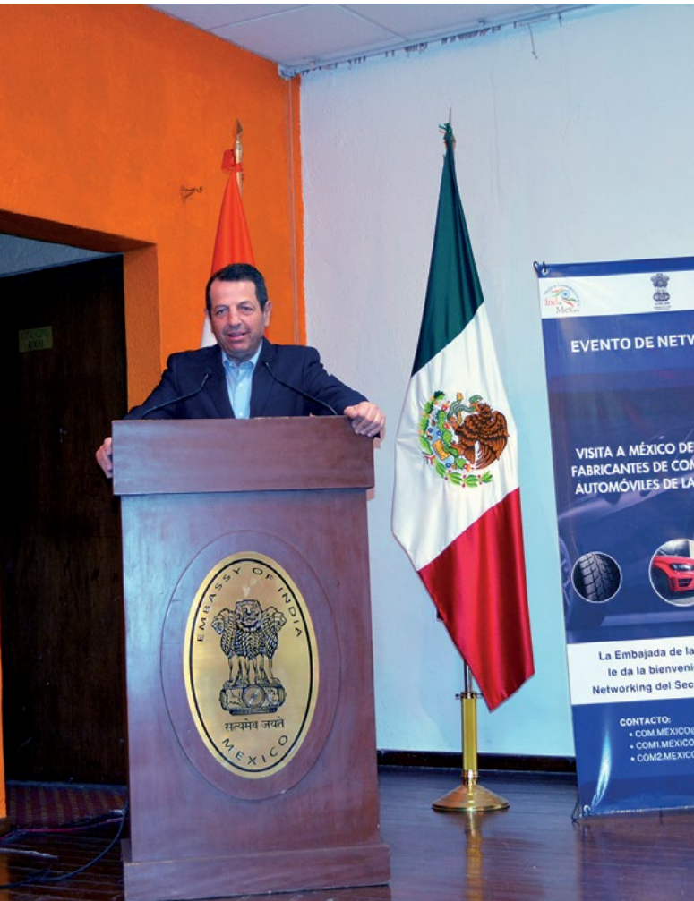
Fadlala Akabani Hneide, secretario de Desarrollo Económico de la Ciudad de México

la recopilación, difusión y pronóstico de datos auténticos de la industria. Realiza investigaciones y publicaciones sobre áreas relevantes de la industria de componentes de automóviles para sus diversas partes interesadas.