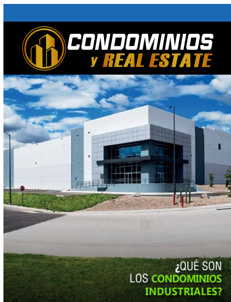
- PORTADA -